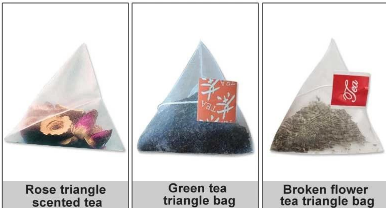
Rose triangle scented tea