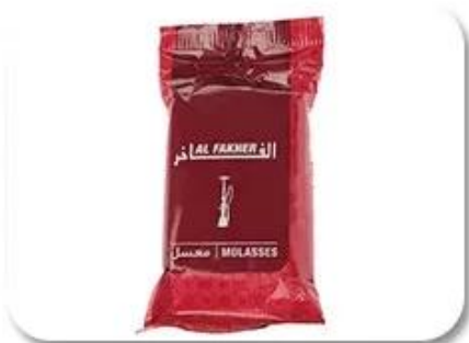
Plastic Bag Packing