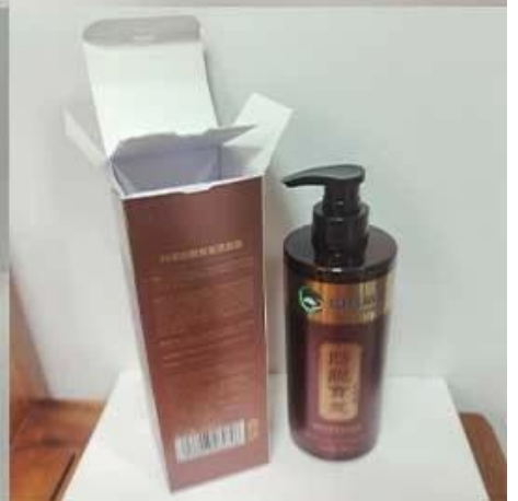
Vantagens do produto