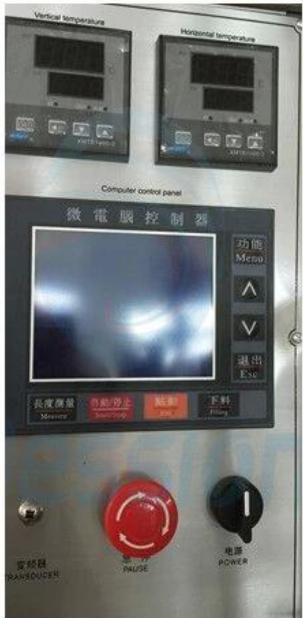
Acabamento de Metal