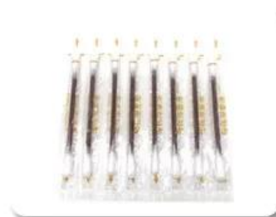
Sterile Cotton Swab