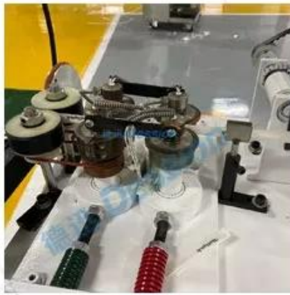
Bag sealing device