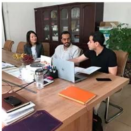
Collect Customer Needs