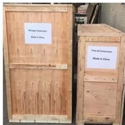
Wooden Box Packing