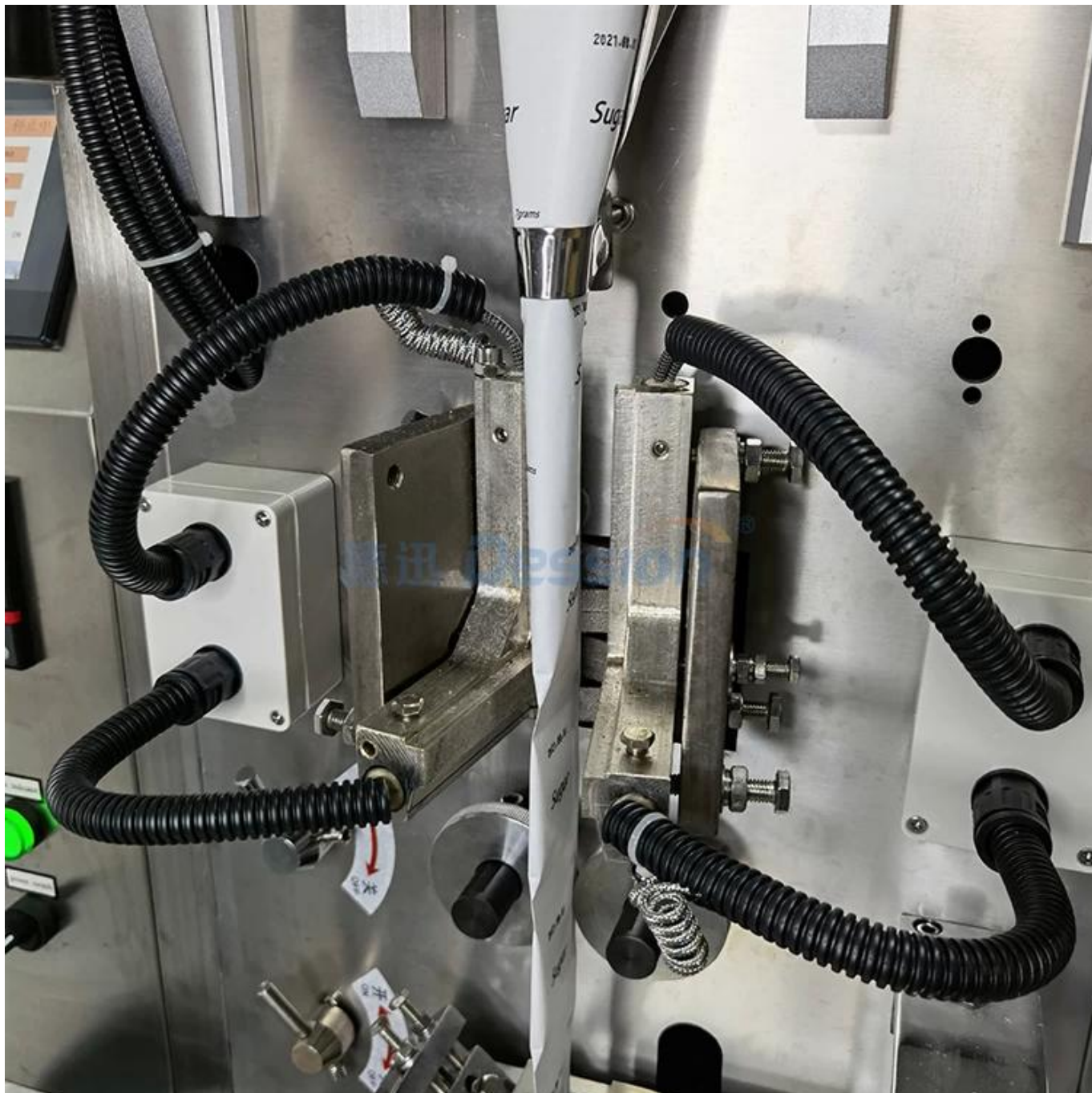
dispositivo de vedação