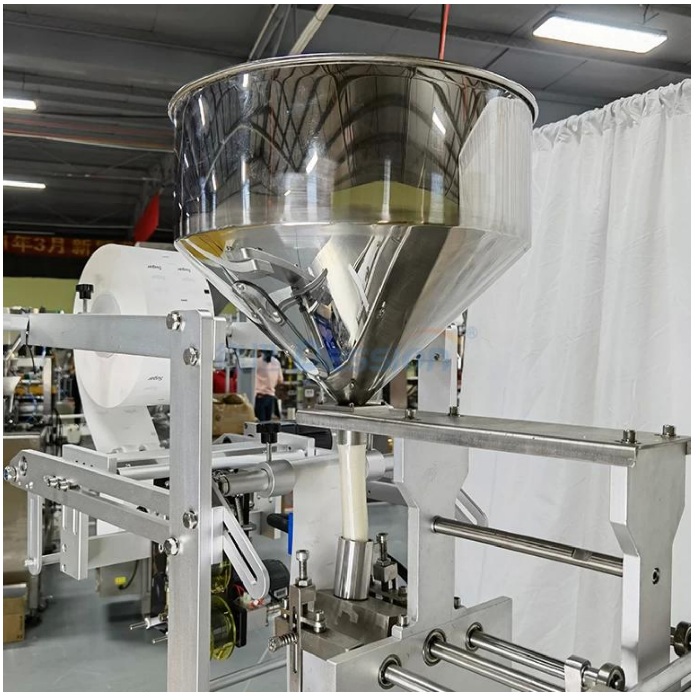
Funil e copo medidor