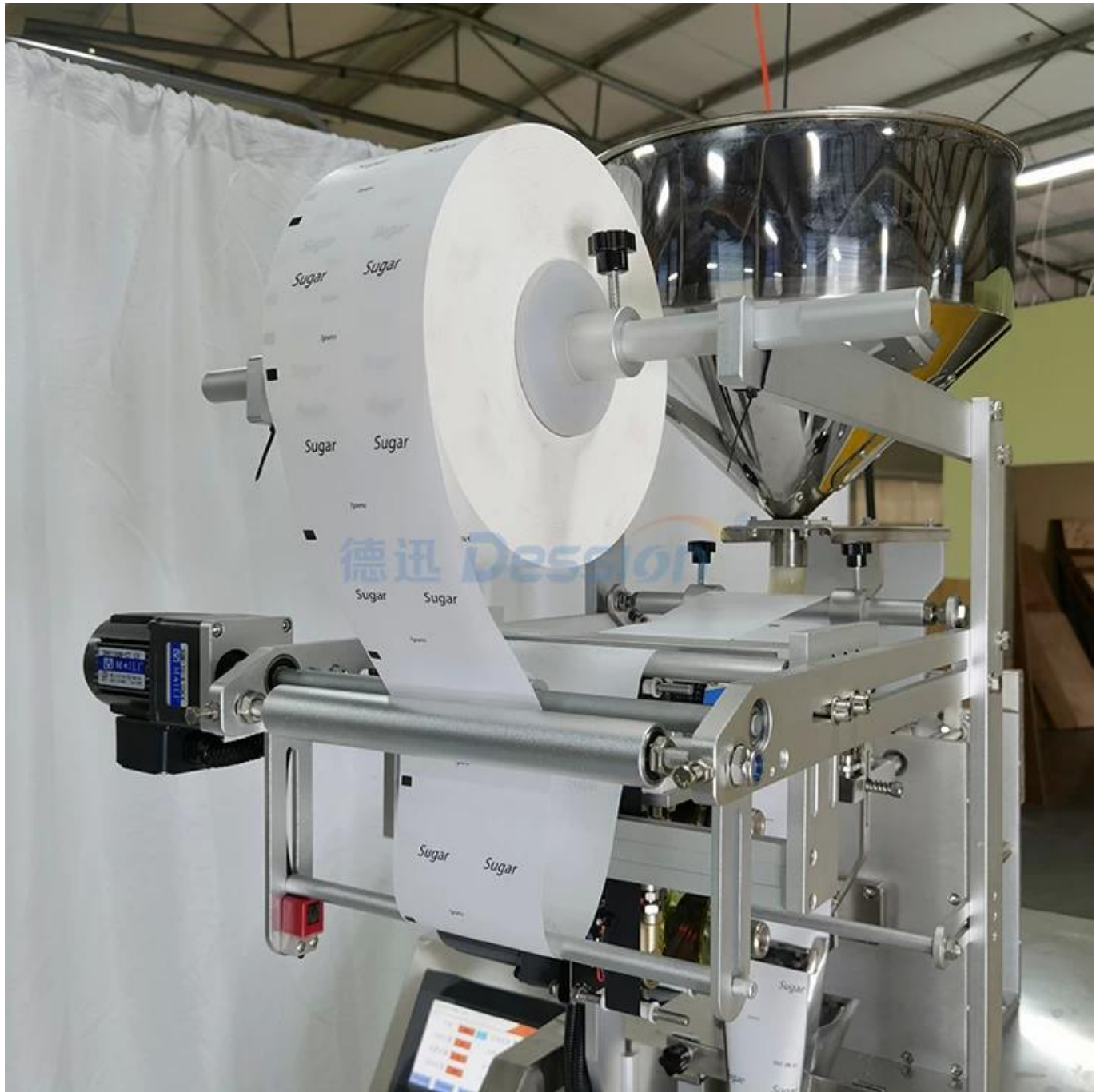
suporte de filme