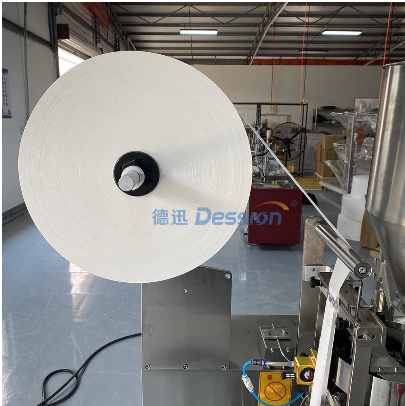
Suporte de filme