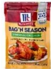
3/4 side seal bag