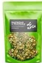
Stand up pouch bag