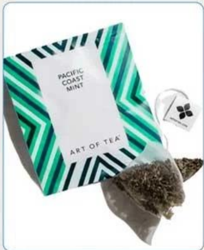
Tea Bag With Envelop