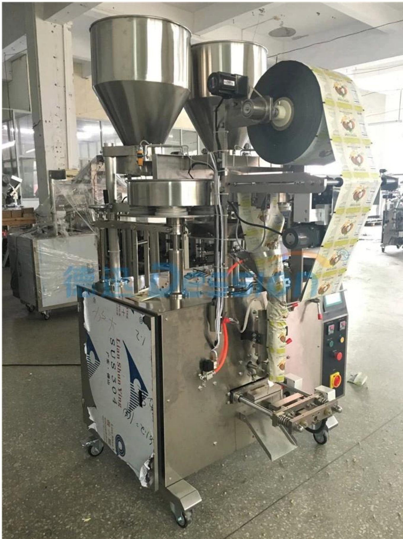
2. Vista Lateral