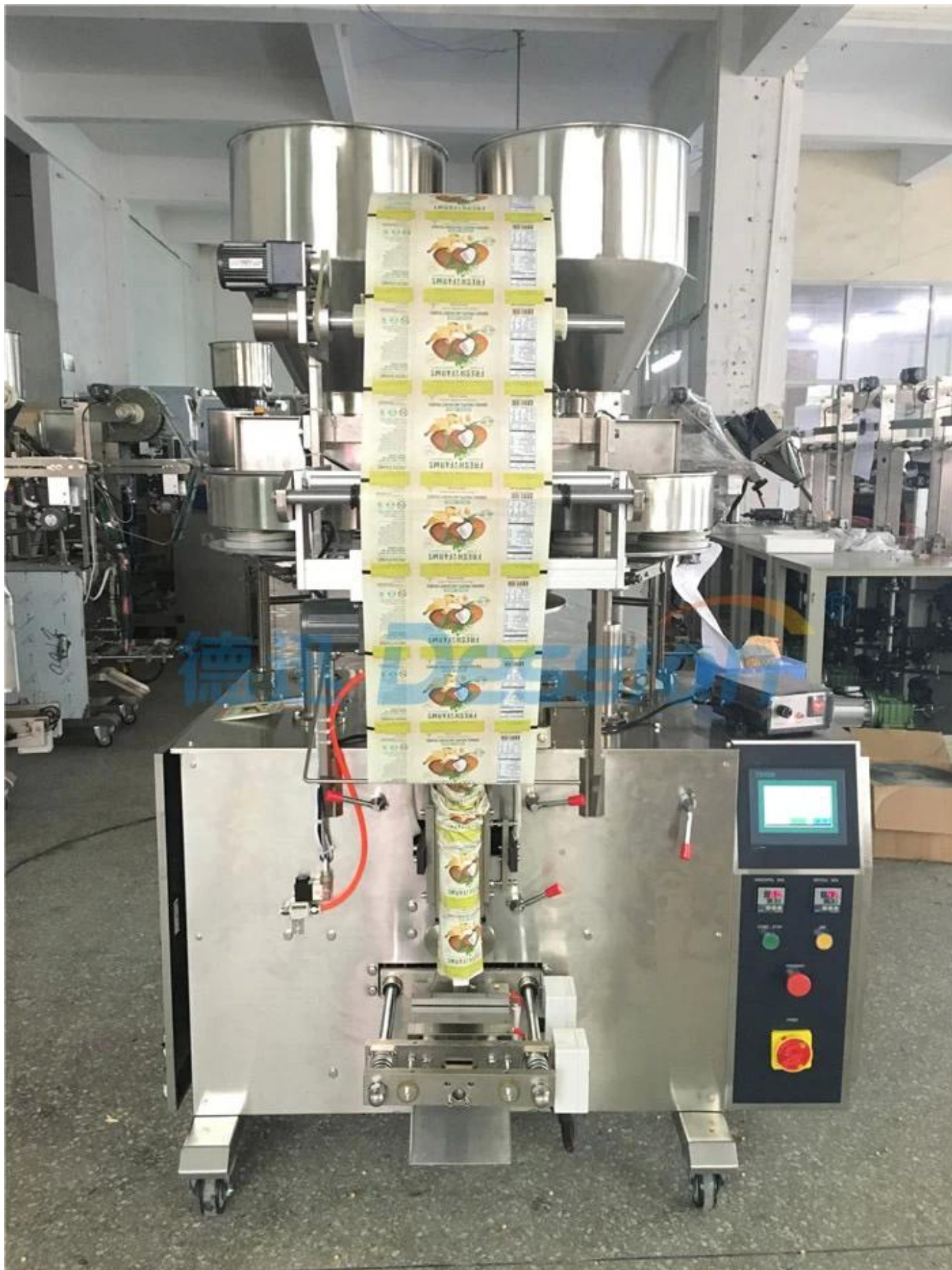
1. Vista Frontal