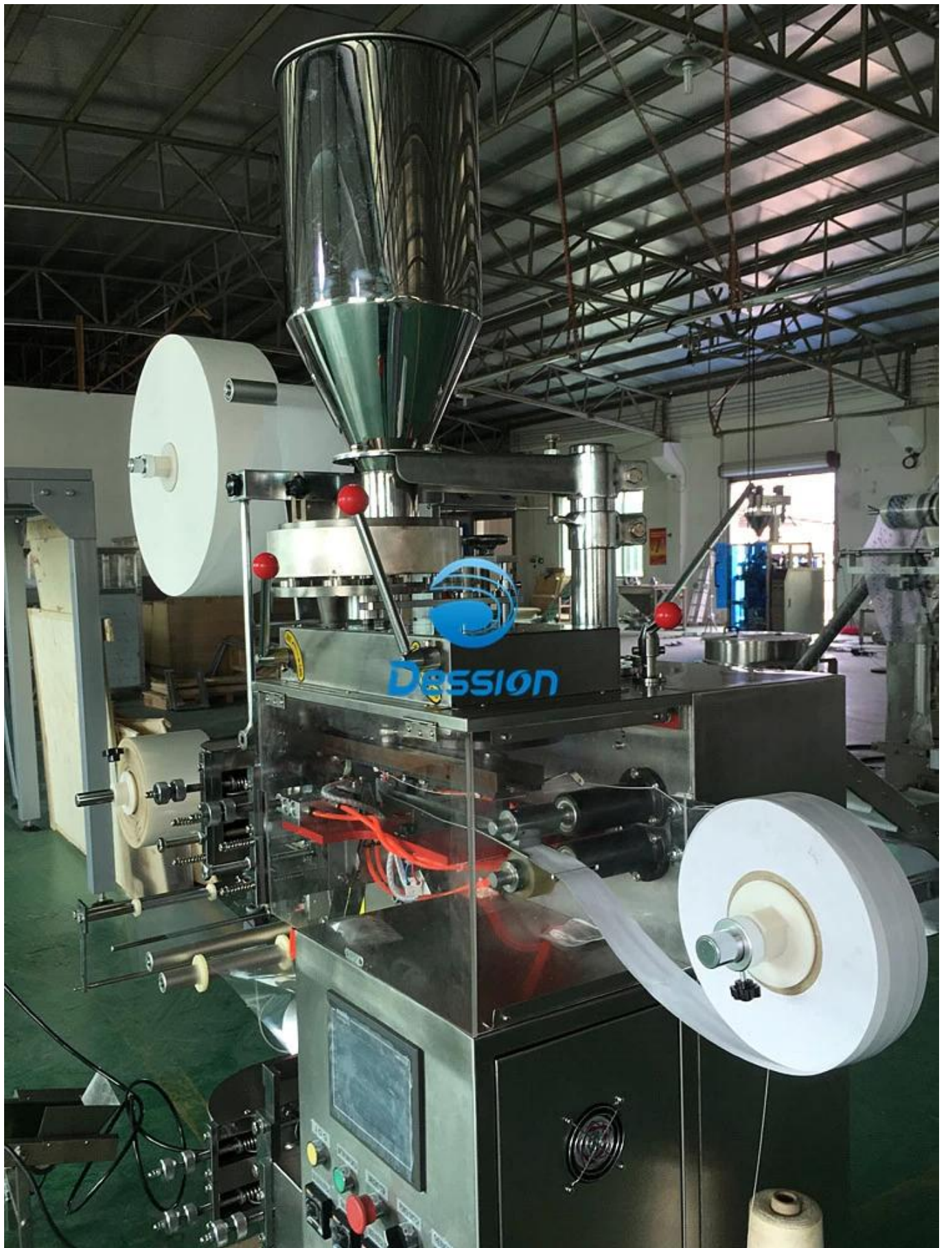
Processo de máquina para embalador de chá