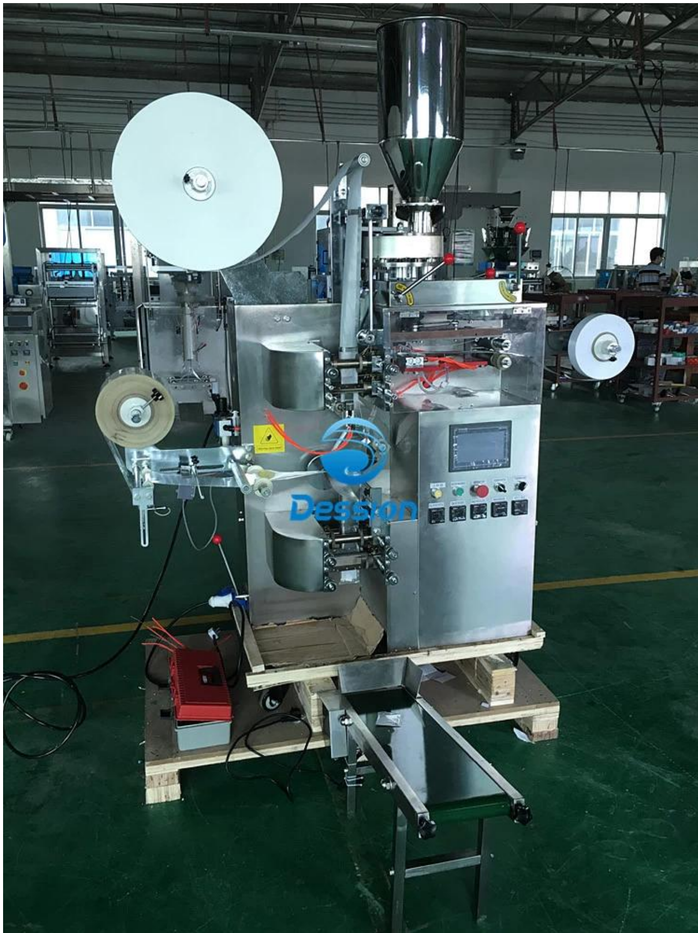
Máquina de embalagem de saquinhos de chá para saquinhos de chá Dip