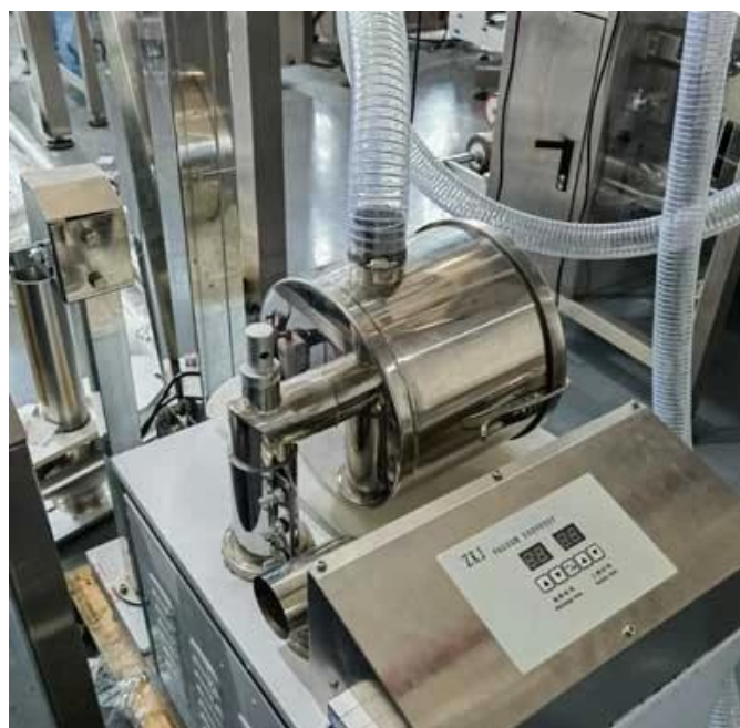
alimentador de vácuo

Adequado para alta precisão de medição e fácil mata de cursação quantitativa, embalagem quantitativa