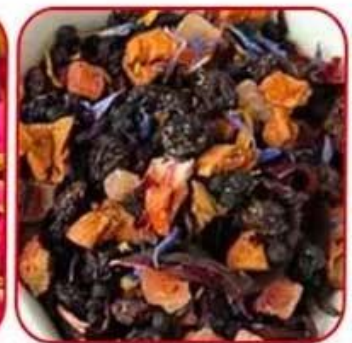
Particles of tea