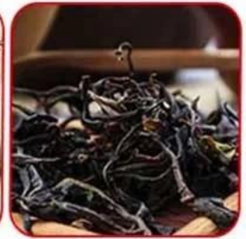
Ceylon black tea