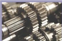
High quality material