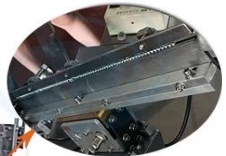
Precise Skid Trail