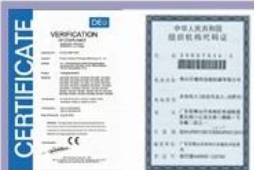
Tight quality control