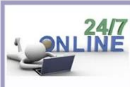
7-24 Hours services