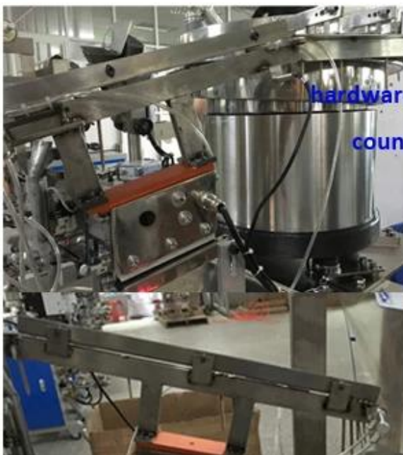
hardware screws/nuts/bolts nails/fastener, counting package solution