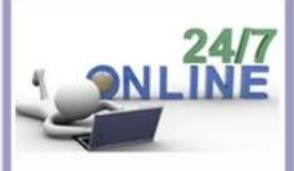
7-24 Hours services