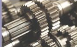
High quality material