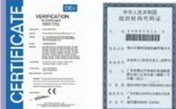
Tight quality control