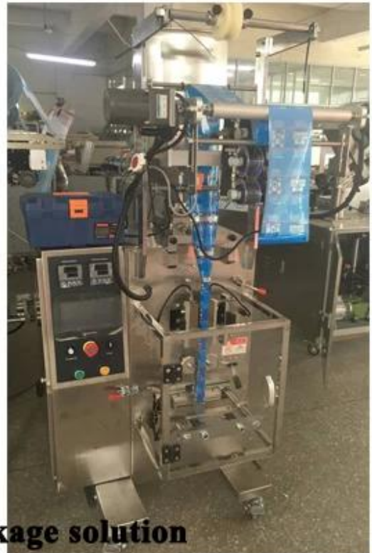
Sachet tomato ketchup package solution 20L hopper for liquid storage, can be customized