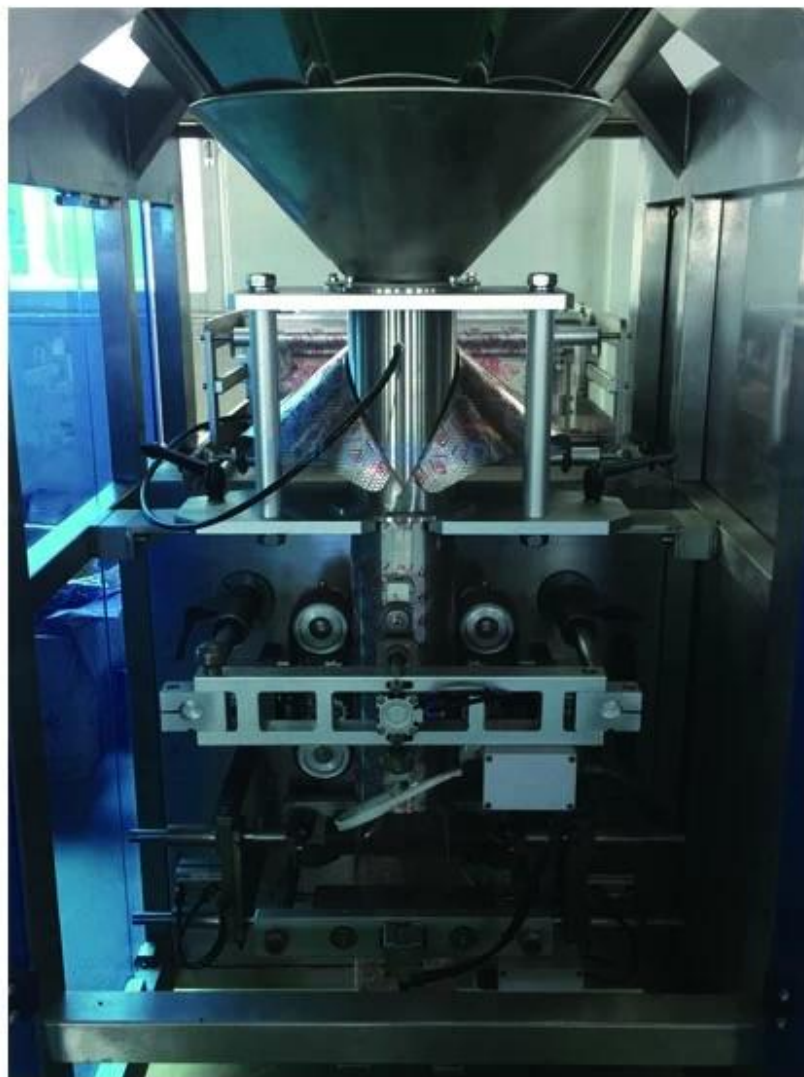
MAIN PACKING MACHINE