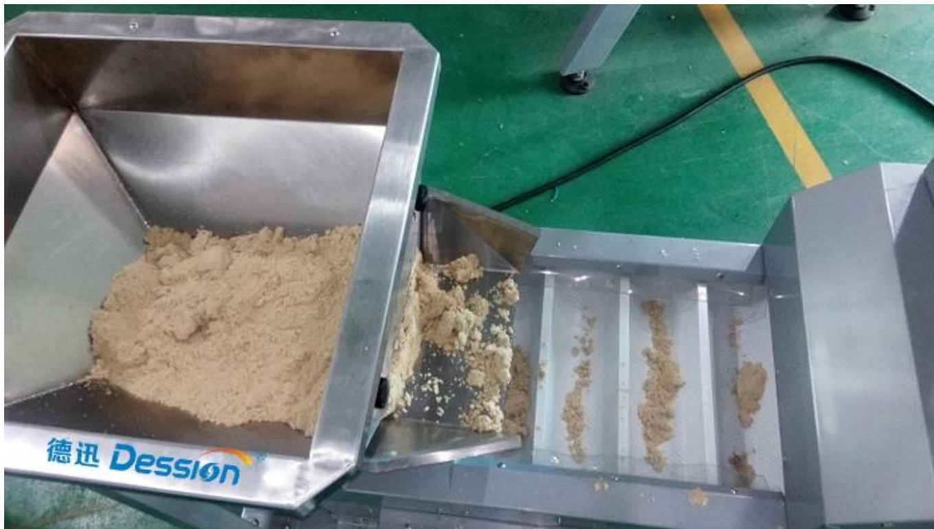
Упакованные пункт 2 Хоппер и идет в