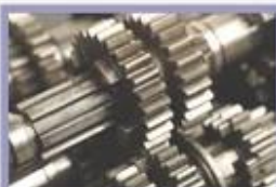
High quality material