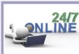
7-24 Hours services