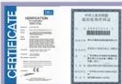
Tight quality control