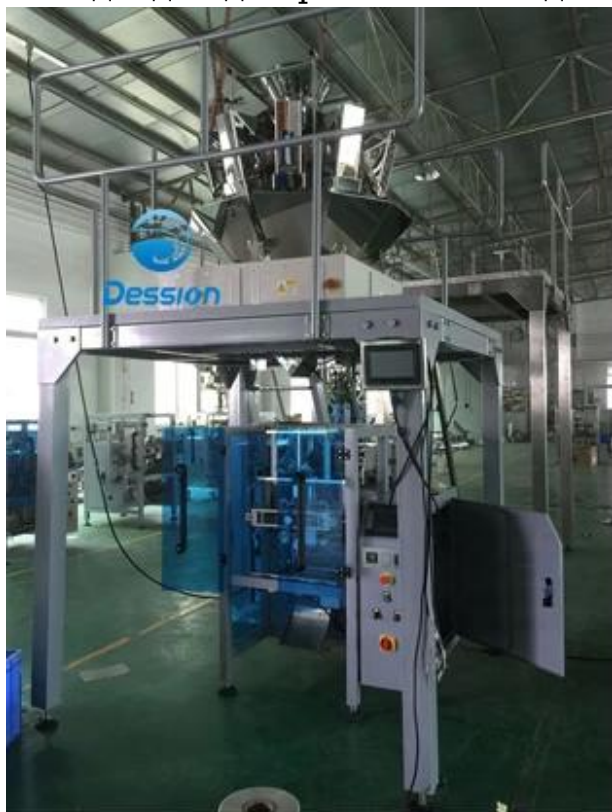
10 head Combination Scale