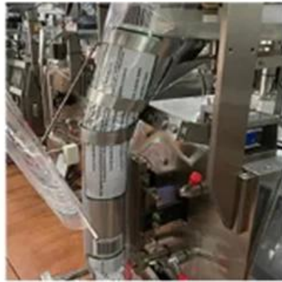
Bag Former and Bag Sealing Device