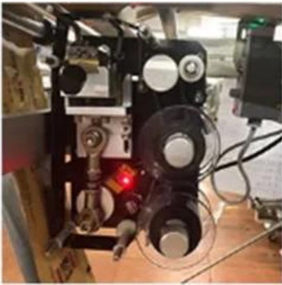
Date Printing Device