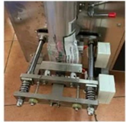
Bag Cutting Device