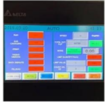
Touch Control Screen