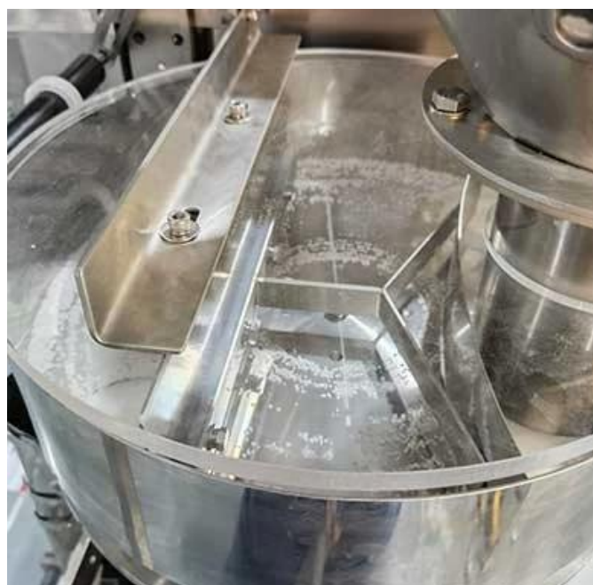
Высокоточное мерное устройство