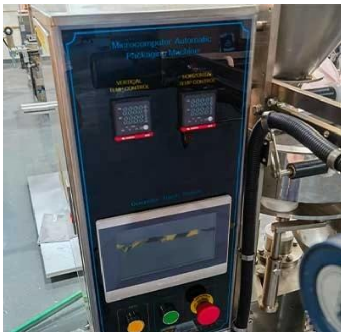
Умный сенсорный экран