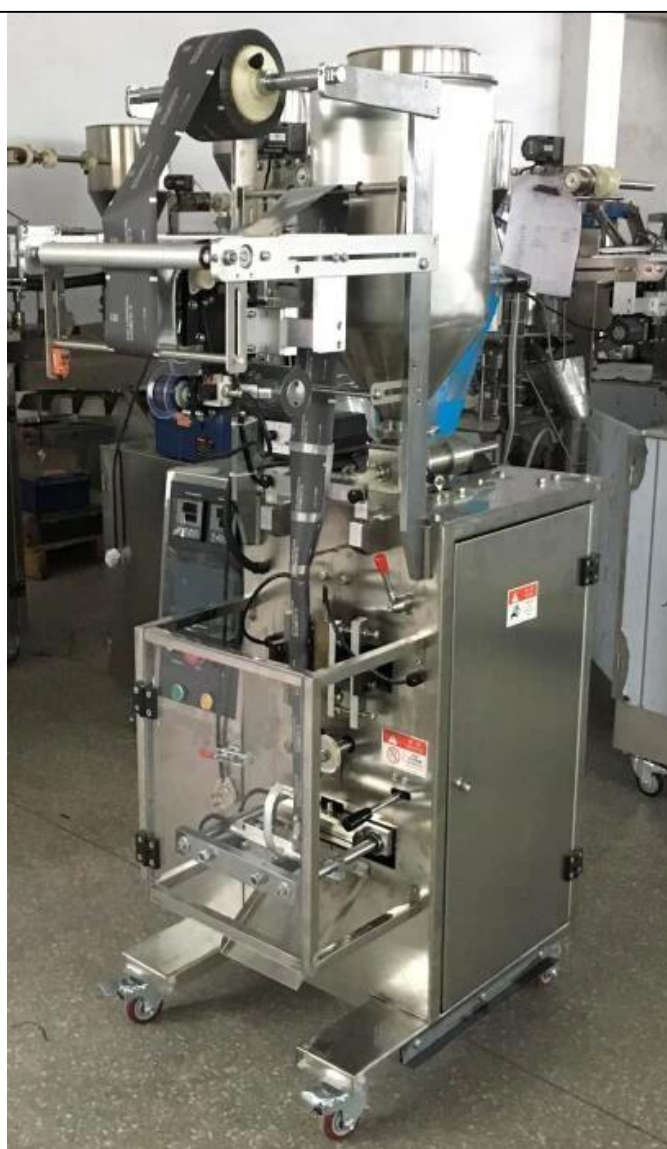
ПРАВая СТОРОНА МАШИНЫ

Автоматическая упаковочная машина Dession