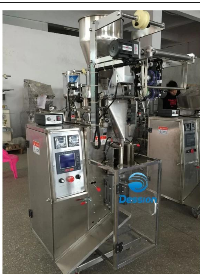
ЛЕВАЯ СТОРОНА МАШИНЫ

Автоматическая упаковочная машина Dession