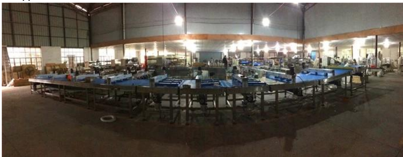
ПЕРЕДНЯЯ ЧАСТЬ МАШИНЫ