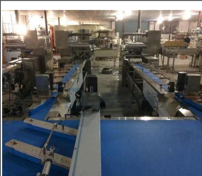
МЕСТНАЯ ЗОНА МАШИНЫ