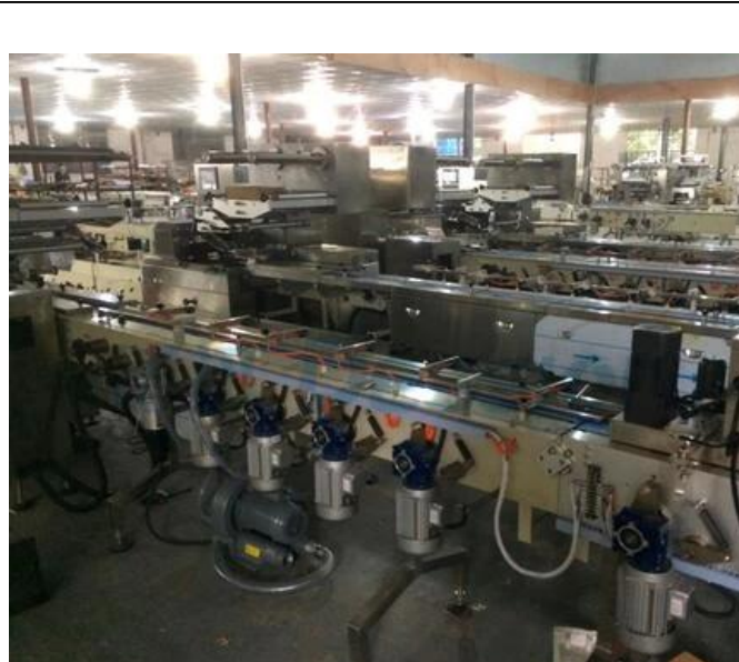
МЕСТНАЯ ЗОНА МАШИНЫ