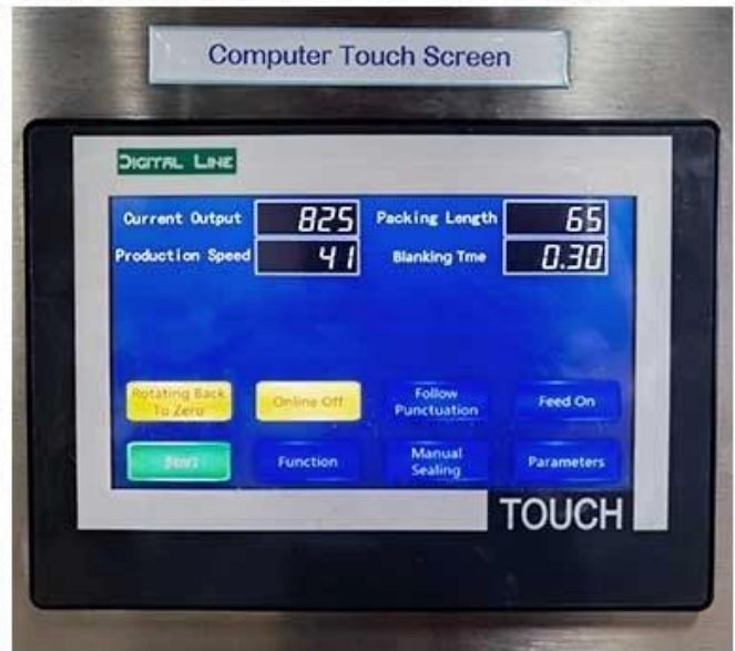
Simple operation of Chinese and English settings