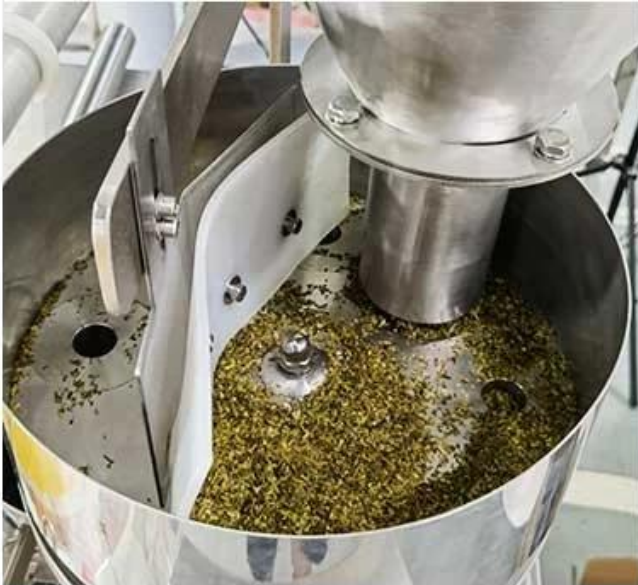
Put the tea leaves into the machine and stir them.