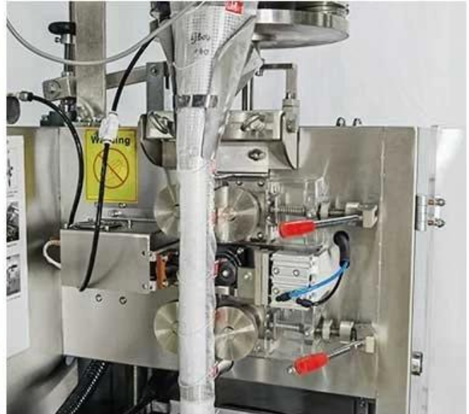
The roller is accurate and stable, and the service life is long.