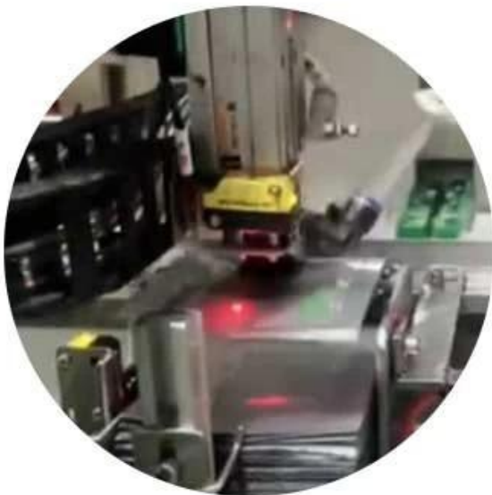
Vacuum suction device

With adjustment function, adjust and customize according to needs