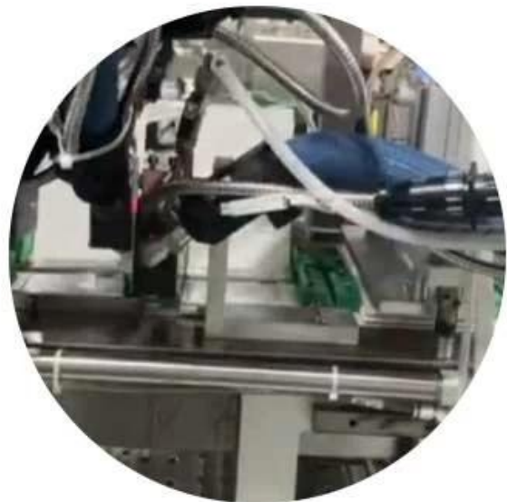
Sealing, spray glue

Electric eye induction, vacuum adsorption