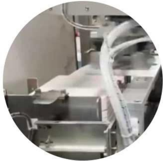
Vacuum suction box

Envelope shape holder, can be customized, according to the size requirements to customize the desired shape