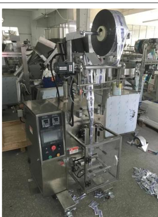
ЛЕВАЯ СТОРОНА МАШИНЫ

Автоматическая упаковочная машина Dession