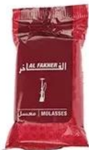
Plastic Bag Packing