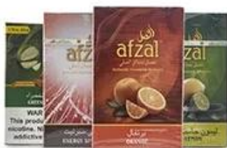
Cellophane & Tear Line Wrap