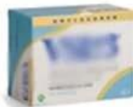
Bag Into Box