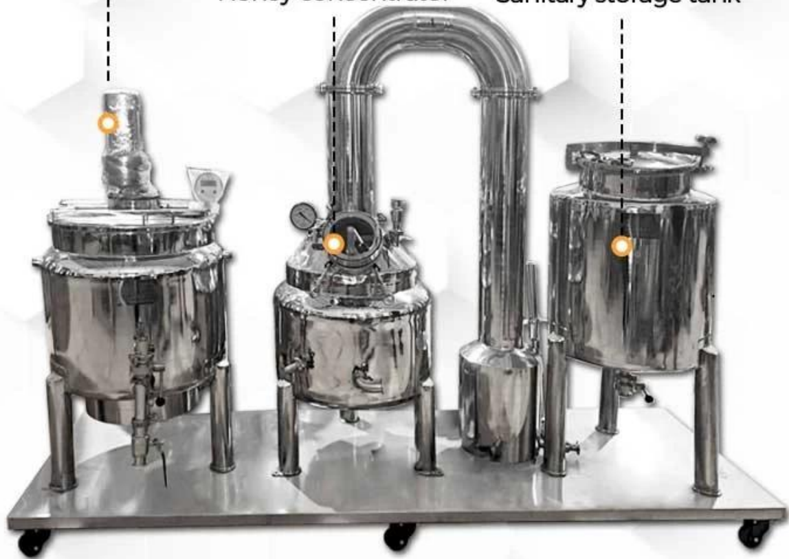
Preheating cylinder Honey concentrator Sanitary storage tank