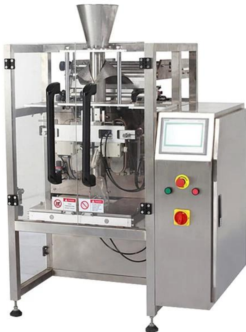
Мультиголовочный весовой дозатор