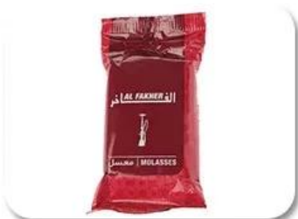
Plastic Bag Packing