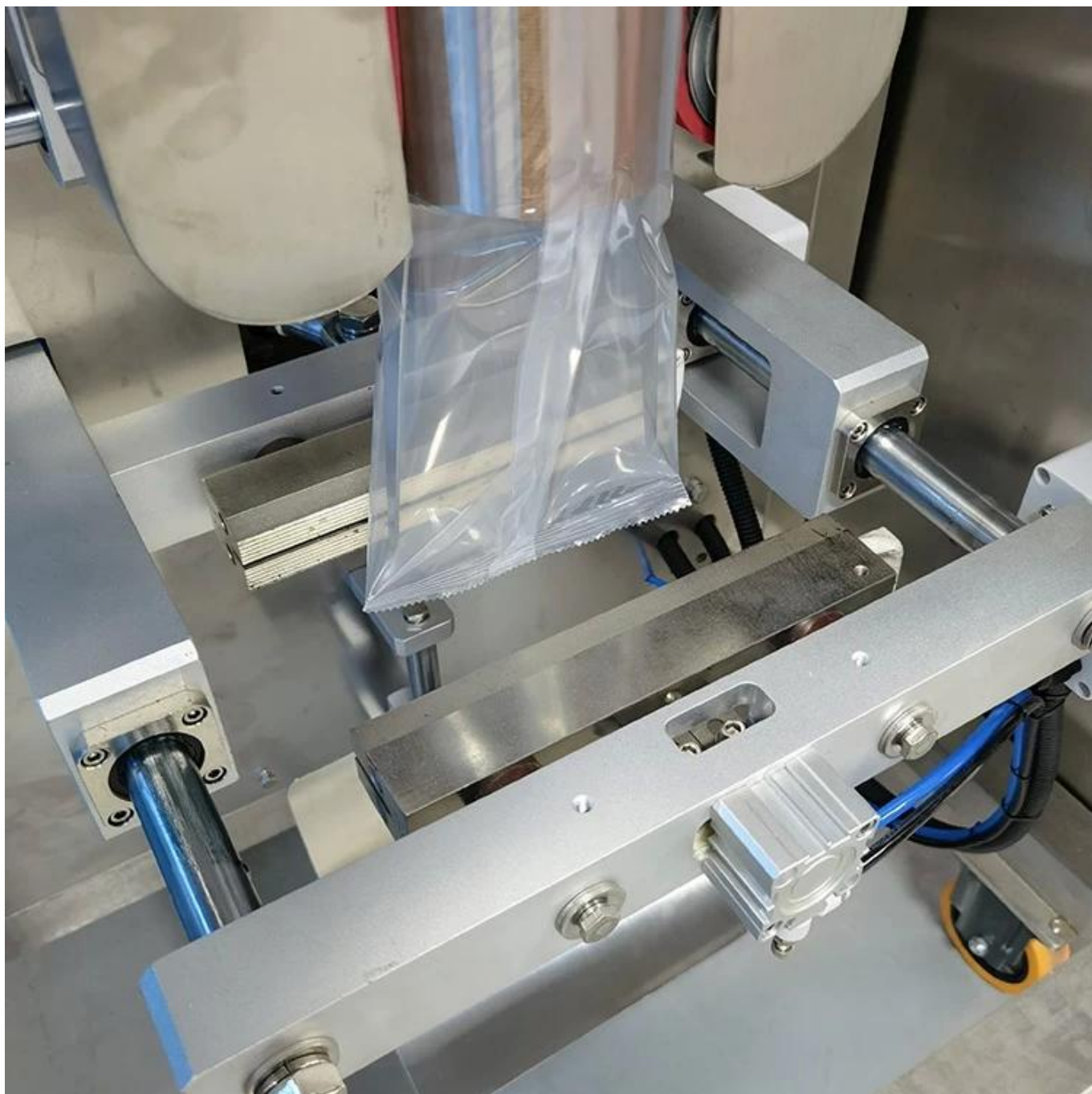
Устройство для резки пакетов