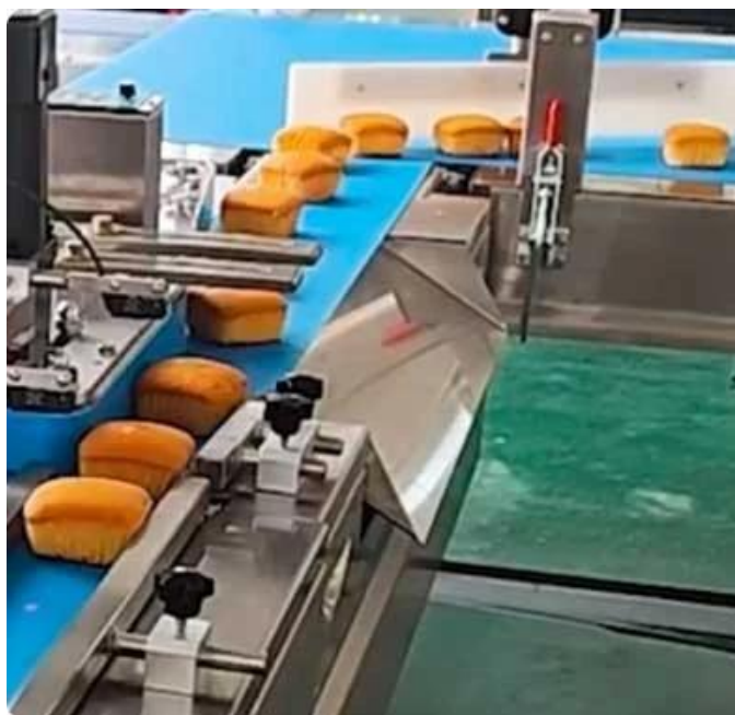
Устройство отбраковки Автоматически отклонять неквалифицированные продукты