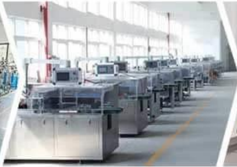
CARTONING MACHINE WORKSHOP