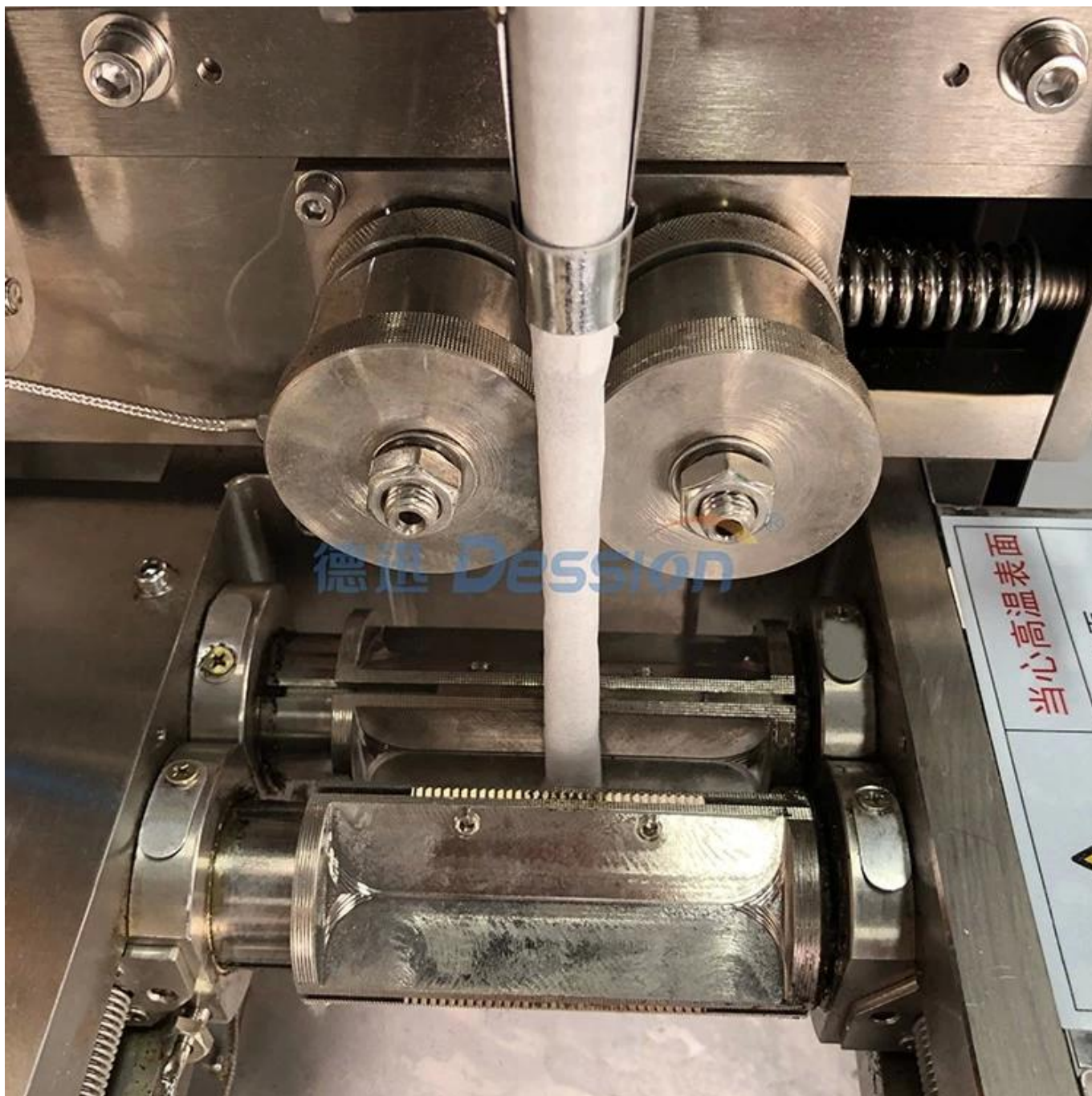
Устройство для запечатывания и резки пакетов