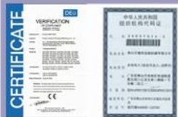
Tight quality control