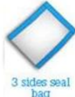
3 sides seal bag