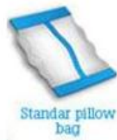
Standar pillow bag