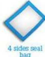
4 sides seal bag