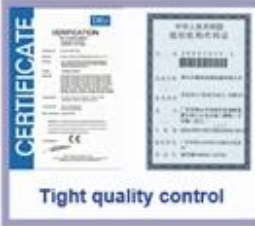
Tight quality control