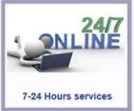
7-24 Hours services