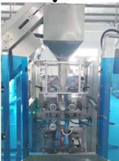
5. Material on Container