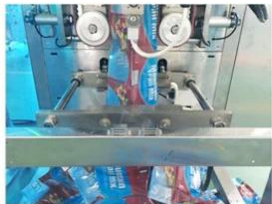
6. Bag Making

500g Rice Cake Semi - Automatic Wrapper Packaging Machine with