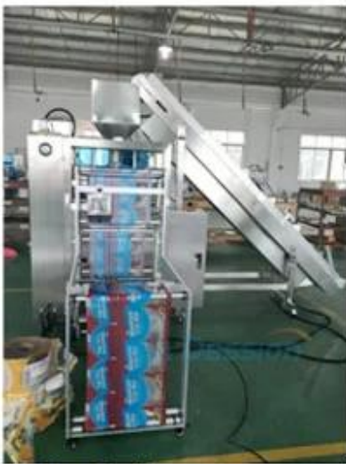
4. Film Pulling