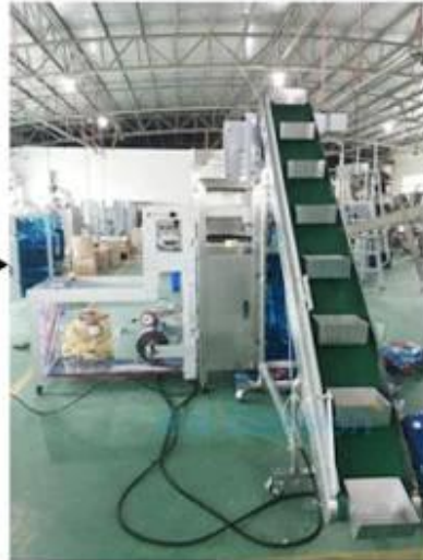
2. Material goes up by the chain