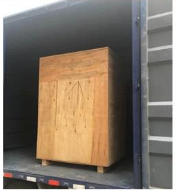
2g - 20g Snus Paketleme Makinesi Fiyatı Çinli Tedarikçi