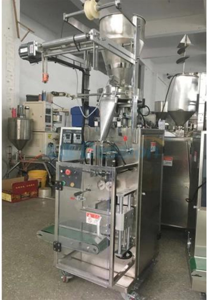
Ön ve Yan V görünüm