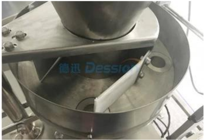
Kupa Buluştu ering