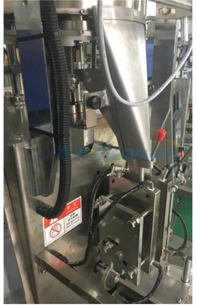
Sırt çantası şekillendirme