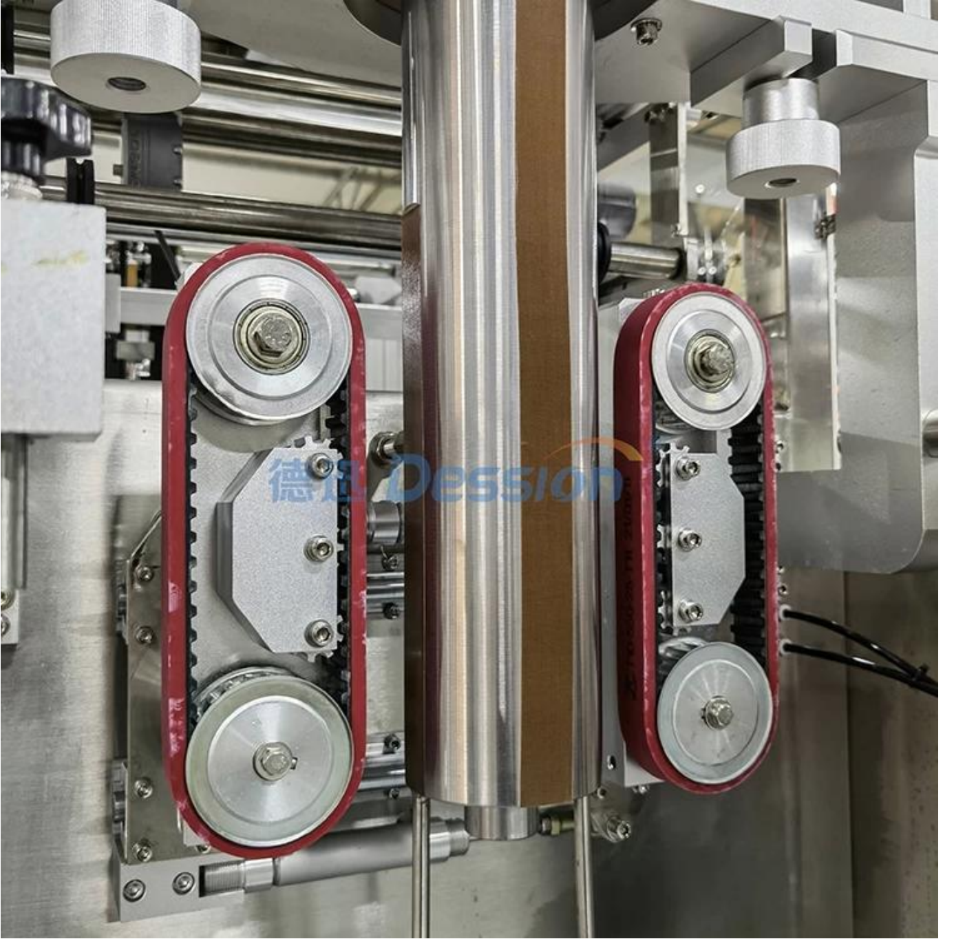
Sızdırmazlık parçası ve torba üreticisi