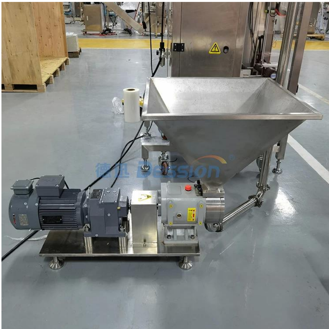
pompa ve hazne