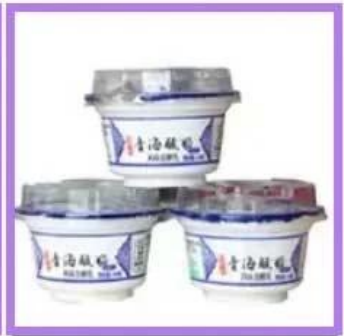
Cup & Bowl