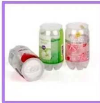
Jar & Can