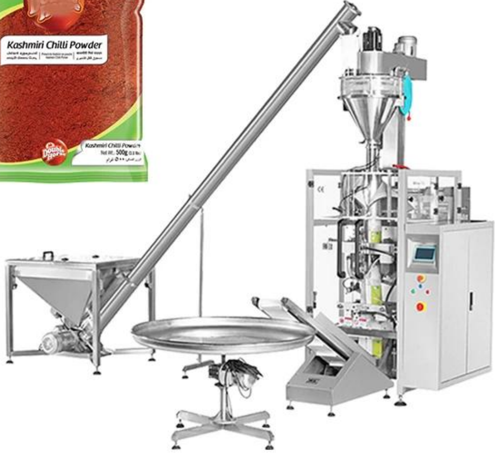
Makine Detayları Tüm Görünüm