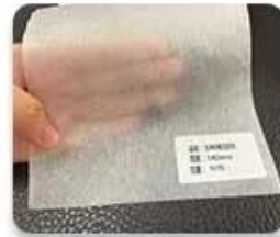
Corn fiber non-woven fabric