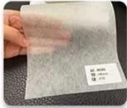
Ripple non-woven fabric