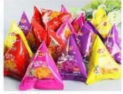
Puffed Food / Snacks / Dried Fruit