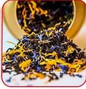
Earl Grey Tea