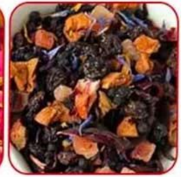
Particles of tea