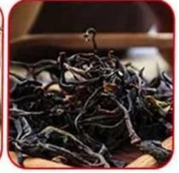
Ceylon black tea