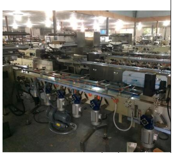
MAKİNEİNİN YEREL ALANI