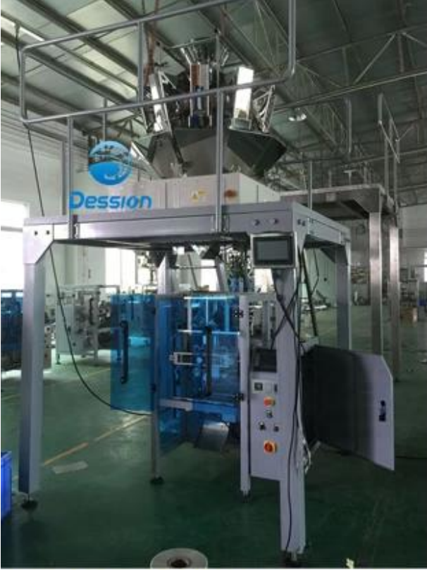
10 head Combination Scale